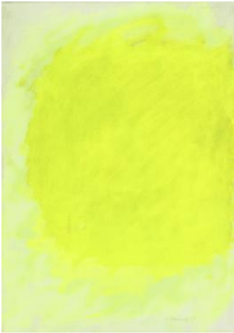
Arnulf Rainer Gelbe Übermalung, 1958 Öl auf Leinwand, 70 x 50 cm