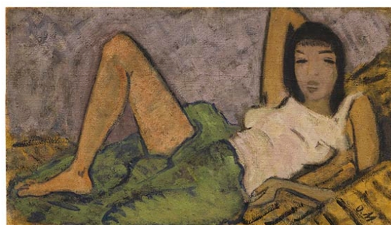
Otto Mueller Mädchen auf dem Kanapee, 1914