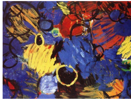
Ernst Wilhelm Nay Motion, 1962