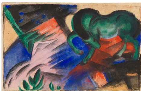
Franz Marc Grünes Pferd, 1912.