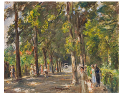
Max Liebermann Große Seestraße in Wannsee, Um 1925.