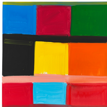
Stanley Whitney Stay Song #54, 2019 .