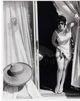
Cindy Sherman Untitled Film Still #7, 1978.