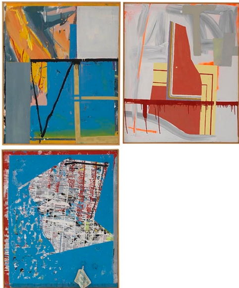
Martin Kippenberger Gruga-Bad, 1982.