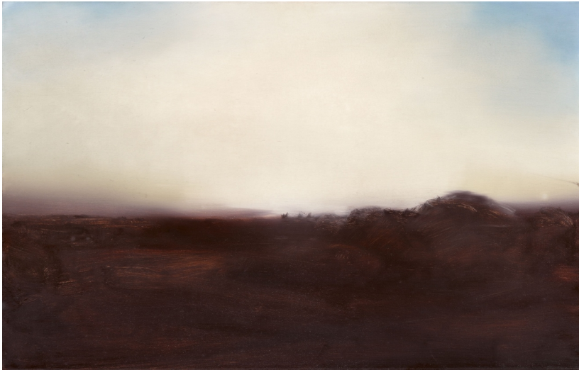
Gerhard Richter Teyde-Landschaft, 1971