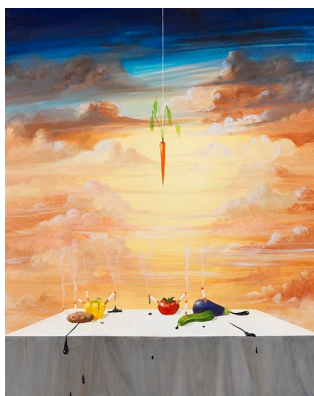
George Condo The Life We Love, 2004.