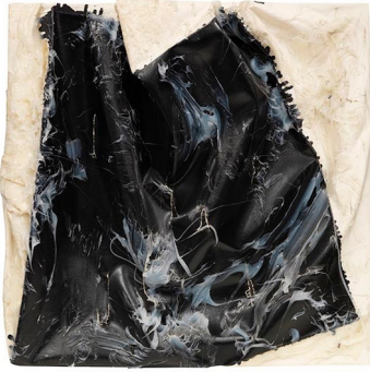
Steven Parrino BLOB #3, 1994.