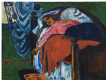
Hermann Max Pechstein Die Ruhende, 1911.